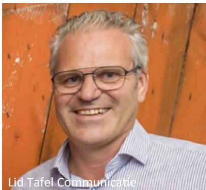
Lid Tafel Communicatie

Nu zijn we bezig met de voorbereiding voor ons nieuwe huis in Haven-