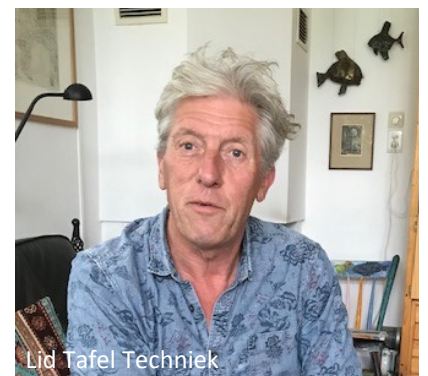
Lid Tafel Techniek

Ons huis, bouwjaar 1964, is door de vorige bewoners aangepakt en geïsoleerd. Wij hebben een aanbouw gezet met extra aandacht voor isolatie (vlas) en duurzaamheid. Het heeft een plat dak met zonnepanelen welke betaald zijn